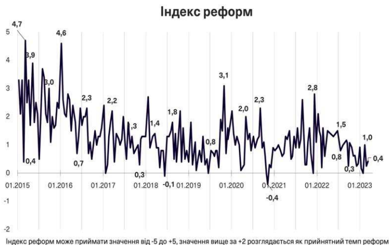
Рис. 2.1. Динаміка Індексу реформ

Реформи, які проводилися в Україні від 2014 р., попри їх несистемність і суперечливість результатів, все ж таки дали можливість істотно просунутися у напрямі побудови повноцінних політичних і бізнес-інститутів насамперед за рахунок дерегуляції економіки, що було однією з основних вимог ЄС для надання українцям безвізового режиму. Динаміку реформ проаналізувала аналітична платформа Вокс Україна*. Реформи вимірювалися за 5-бальною шкалою в діапазоні 5 – найкраще, 0 – найгірше (див. рис. 2.1) 81 .