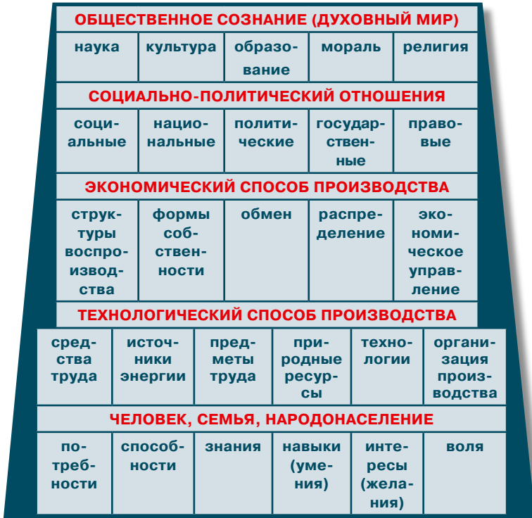
Рисунок 2.2. «ПИРАМИДА» ЦИВИЛИЗАЦИЙ

Все эти элементы тесно связаны, переплетены, различаются от цивилизации к цивилизации, меняются от эпохи к эпохе.