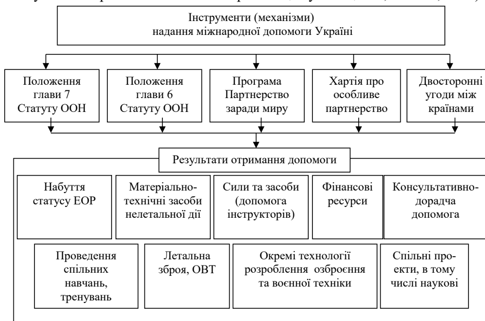
Рис. 3. Механізми отримання міжнародної допомоги та очікувані результати

процесі протидії гібридним загрозам (Федянович, Камолаєва, 2018, с. 67–75; Іващенко, Возняк, 2018). Разом з тим, як показав проведений у Центрі воєнно-стратегічних досліджень аналіз операцій у рамках гл. 6 та 7 Статуту ООН, ці операції практично не можуть бути реалізованими для припинення конфлікту на Сході України (Іващенко, Возняк, 2018).